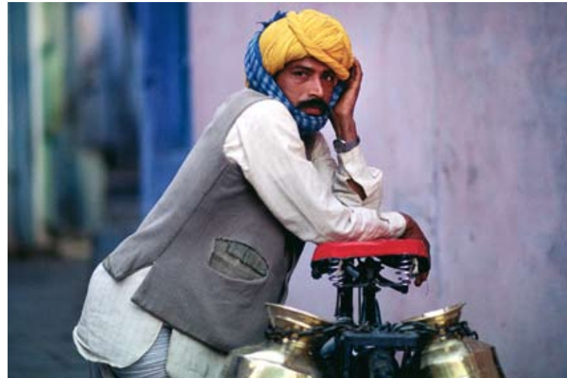
Farbspiele – Milchmann in Bundi