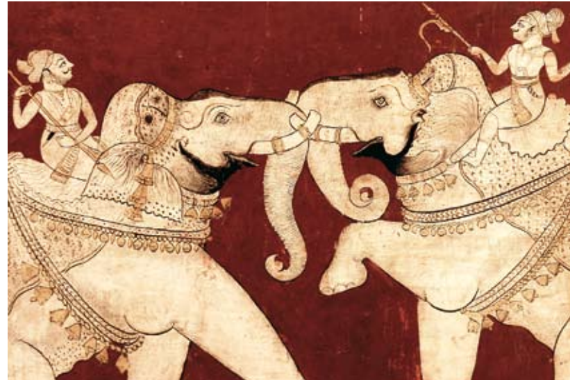
Kämpfende Elefanten auf den Paneelen des Chitrashala, Bundis berühmten Pavillon der Gemälde